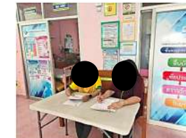
ผู้อำนวยการโรงพยาบาลส่งเสริมสุขภาพตำบลโพธิ์พัฒนา