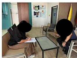
ผู้ใหญ่ หมู่ที่ 9 บ้านเขาสว่างอารมณ์