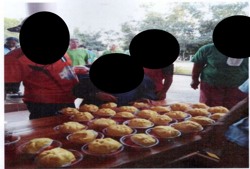
อาหารว่างสำหรับวันออกกกำลังกาย

สนับสนุนโดยกองทุนสุขภาพของ หจก.ศิลา กำแพงเพชร 2 ประจำปี 2568