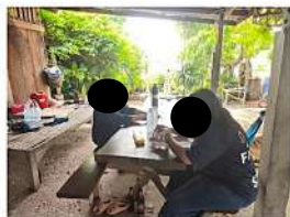
ผู้ใหญ่บ้าน หมู่ที่ 8 บ้านป่ามะพร้าว