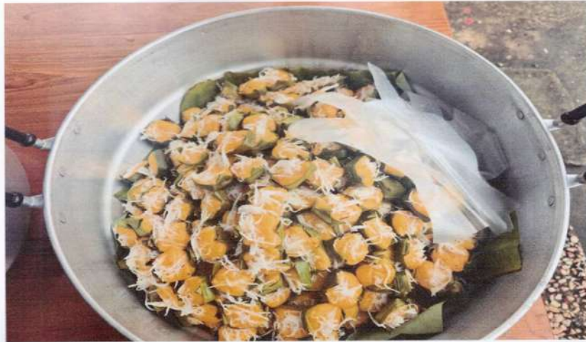
อาหารว่างสำหรับวันออกกกำลังกาย

สนับสนุนโดยกองทุนสุขภาพของ หจก.ศิลา กำแพงเพชร 2 ประจำปี 2568