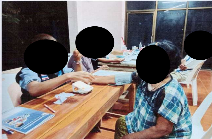
ตรวจคัดกรองค้นหาโรค NCD ในชุมชนโพธิ์พัฒนา

สนับสนุนโดยกองทุนสุขภาพของ หจก.ศิลา กำแพงเพชร 2 ประจำปี 2568