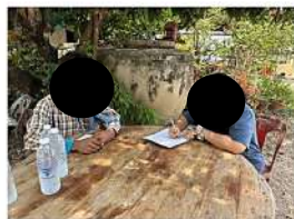
ผู้ใหญ่บ้าน หมู่ที่ 10 บ้านหนองทอง