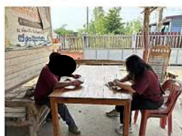
ผู้ใหญ่บ้าน หมู่ที่ 14 บ้านหนองมะคึก