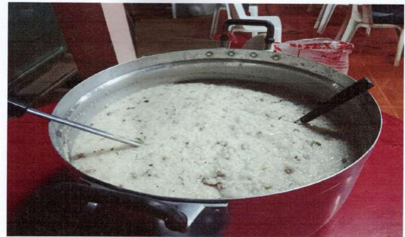
จ้างเหมาทำอาหารให้แก่ประชาชนในวันตรวจคัดกรองสุขภาพ

สนับสนุนโดยกองทุนสุขภาพของ หจก.ศิลา กำแพงเพชร 2 ประจำปี 2568