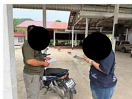
ผู้ใหญ่บ้าน หมู่ที่ 13 บ้านสว่างราษฎร์พัฒนา