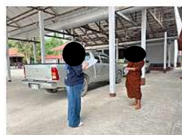
เจ้าอาวาสวัดเขาสว่างอารมณ์