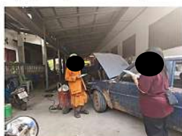
เจ้าอาวาสวัดโพธิ์บดลังก์