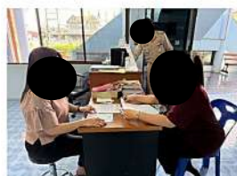
เจ้าหน้าที่โรงพยาบาลส่งเสริมสุขภาพตำบลท่าไม้