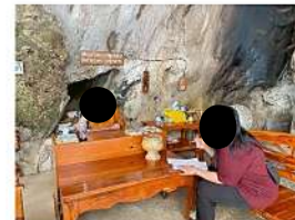
ประธานสงฆ์ สำนักสงฆ์เจ้าเขาพระ

รูปที่ 2: การสัมภาษณ์ผู้นำชุมชน และพื้นที่รอบนอกในรัศมี 3 กิโลเมตร จากพื้นที่โครงการ