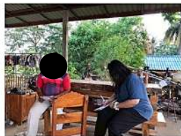
ผู้ใหญ่บ้าน หมู่ที่ 9 บ้านใหม่โพธิ์พัฒนา