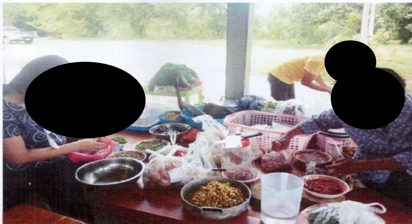
จ้างเหมาทำอาหารในวันกิจกรรม

สนับสนุนโดยกองทุนสุขภาพของ หจก.ศิลา กำแพงเพชร 2 ประจำปี 2568