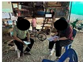
ก้านต้นต่าบถายต๋อง