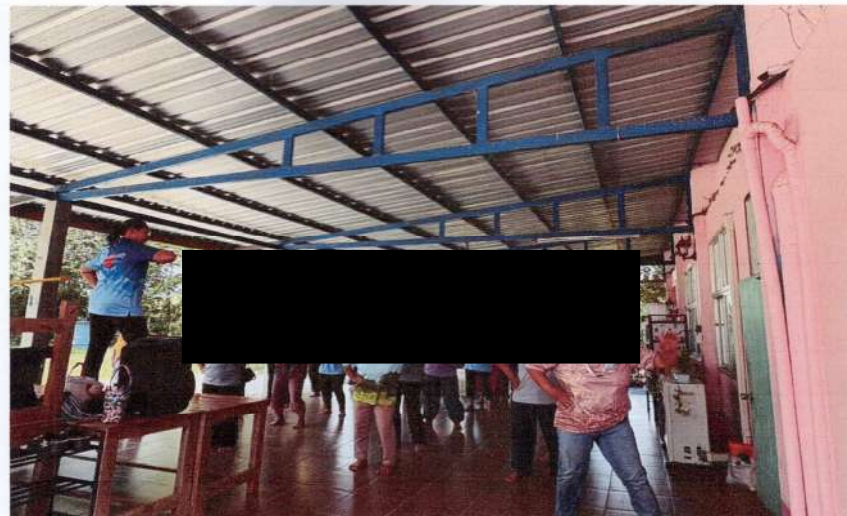
ชมรมสร้างสุขภาพ ชมรมผู้สูงอายุมีกิจกรรมออกกำลังกาย

สนับสนุนโดยกองทุนสุขภาพของ หจก.ศิลา กำแพงเพชร 2 ประจำปี 2568